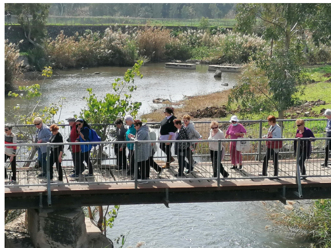
Le groupe de voyageurs au bord du Jourdain

Nous sommes partis en car de Jérusalem en direction du nord. Notre destination était le kibboutz Degania B. Ce kibboutz est situé près du Jourdain, à quelques kilomètres du lac de Génésareth. Ces personnes souhaitaient depuis longtemps visiter un kibboutz et leur rêve est maintenant devenu réalité. En route, nous nous sommes arrêtés sur le site des baptêmes, près de Jéricho. C'est là que Jean-Baptiste exerçait son ministère. La guide Lena a expliqué en russe l'histoire palpitante de ce lieu. L'après-midi, nous sommes arrivés au kibboutz. Ce lieu est une oasis de ré-